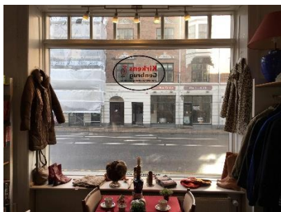
Fra skrot til flot

I anledningen af Design- og Håndværksdagen torsdag d. 3. november afholder studerende fra Håndarbejdets Fremme en inspirationsevent i Kirkens Genbrug på Vesterbrogade 191. Med udgangspunkt i butikkens genbrugstøj vil vi demonstrere, hvordan simple omsyninger og broderede dekorationer kan give dit tøj et nyt og smart look! Kom forbi og bliv inspireret! Kl. 13.00 – 16.30.